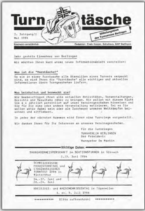
Erstaussgabe der «Turntäsche» Mai 1984.

Ein PC war damals in den Haushaltungen noch nicht anzutreffen und so gab die Gestaltung der «Turntäsche» noch viel Handarbeit. Die Texte wurden erst auf Schreibmaschine, später mit Kugelpf-Schreibmaschine, wo die Möglichkeit bestand, einige verschiedene Schriften zu verwenden, getippt und nachher ausgeschnitten und zu einer Maquette zusammengeklebt, ehe man mit diesen Druckvorlagen zur Druckerei ging. Als gelernter Schriftsetzer waren diese drucktechnischen Herausforderungen für ihn natürlich kein Problem.