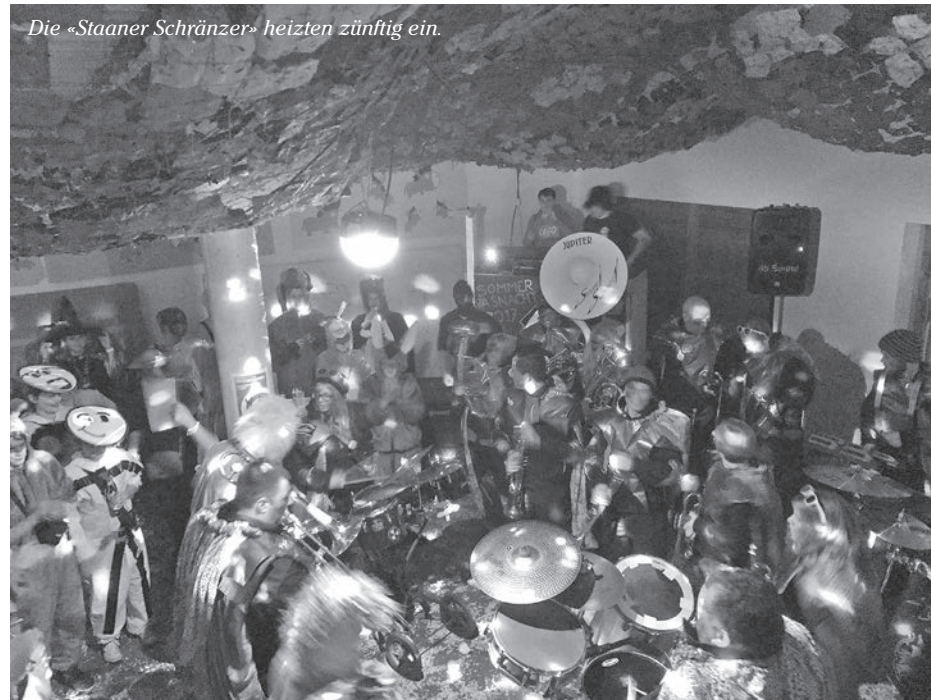
Die «Staaner Schränzer» heizten zünftig ein.