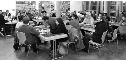
48 Jasserinnen und Jasser nahmen am Saujass teil.