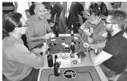
Bis in die frühen Morgenstunden wurde noch weitergejast, wie hier beim «Schieber».