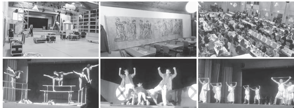
Wir bedanken uns bei folgenden Sponsoren: Druckerei Steckborn, Staub Heizungen, SONGWON, G2 Architekten, DIWISA, Golfclub Lipperswil, Pletscher Getränkehandel, TROJKA Energy