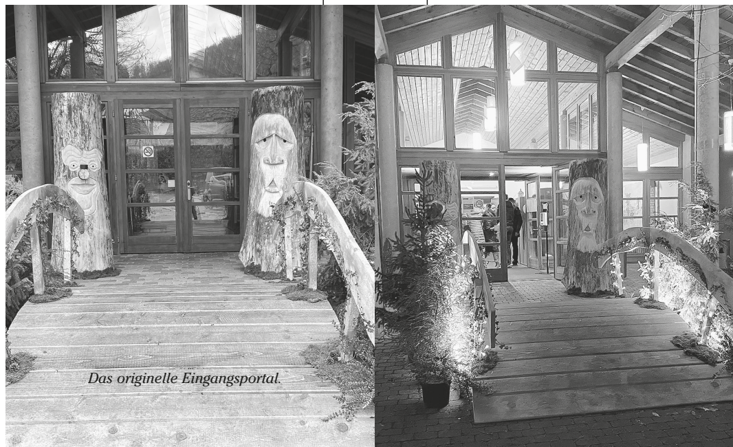
Das originelle Eingangsportal.

Was die vielen Besucher aber schon am Eingang überraschte, war das einmalig, märchenhaft geschmückte und beleuchtete Eingangsportal, wo alle Zuschauer über eine gezimmerte Holzbrücke, flankiert von zwei riesigen, geschnitzten Baumstamm-Säulen den Zugang ins Foyer fanden. Ein grosses Bravo den Machern dieser Kunstwerke. Ein grosses Kompliment auch an das