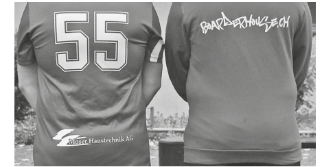
Shirt und Trainerjacke sind mit den Logos der Sponsoren bedruckt.