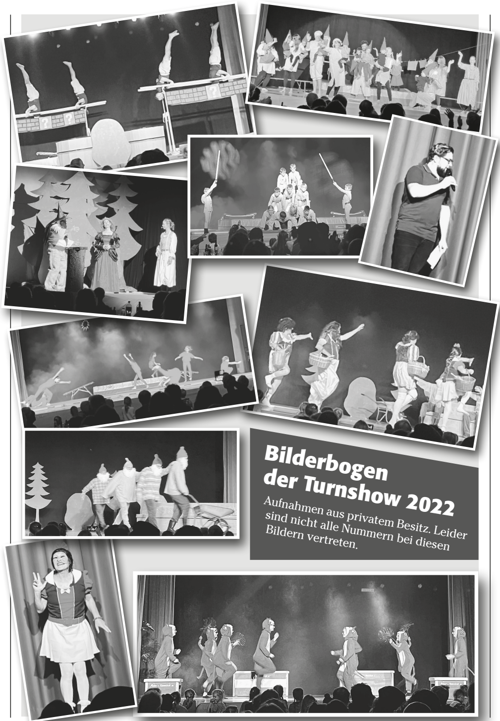
Bilderbogen der Turnshow 2022 Leider sind nicht alle Nummern bei diesen Bildern vertreten.