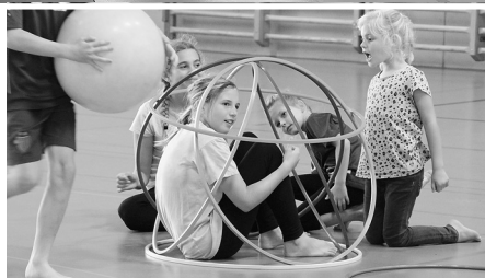
Gefangen in Gymnastikreifen.