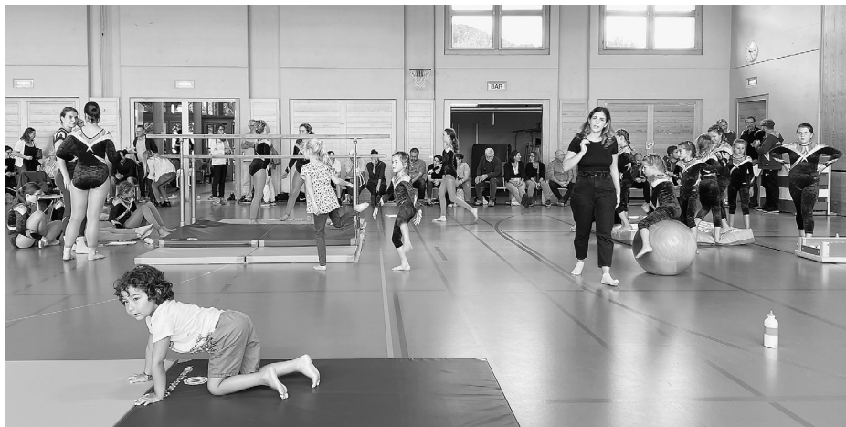
Viel Betrieb herrschte in der Unterseehalle.