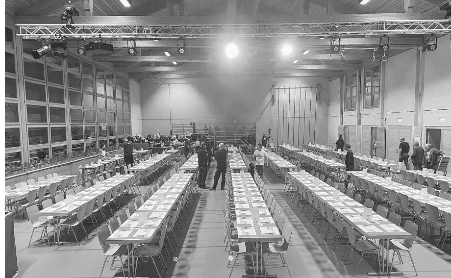
Es ist beinahe fertig angerichtet, noch die von fleissigen Händen hergerichteten Tischdekorationen.

Deko-Team, für die märchenhafte Tisch- und Hallendekoration!