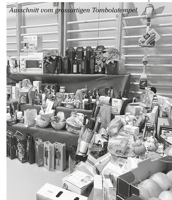
Ausschnitt vom grossartigen Tombolatempel.

ein grosses Dankeschön ausgesprochen. In diesen Dank sind selbstverständlich auch die Leiterinnen und Leiter mit ihren Turnerinnen und Turnern, welche die Turnshow 2022 wiederum in ein bleibendes Erlebnis verwandelten. Und nicht zuletzt sei dem gross aufmarschierten Publikum und allen Turnfreunden aus nah und fern für deren Besuch herzlich gedankt. Erwin Kasper