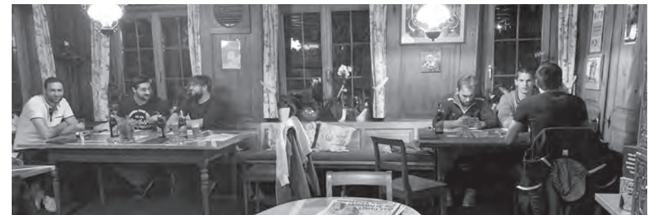
...und Heiss hunger im «Löwen» Mannenbach.