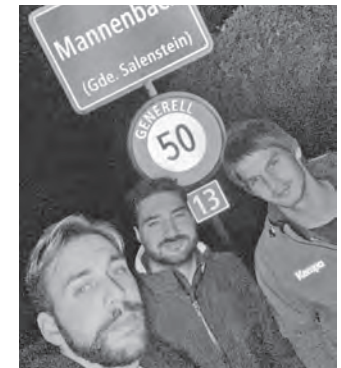
Dunkel war's und der Heimweg lang.