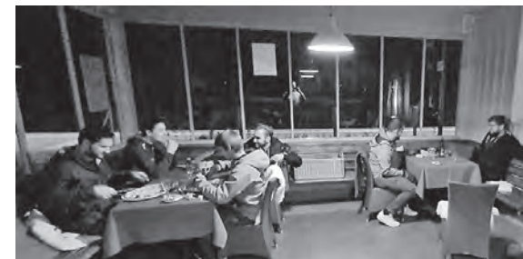
Stärkung im «Lago Mio»...

Kommt Zeit, kommt Restaurant – mal schauen, wo wir die nächsten Freitag-abende verbringen. Ricci