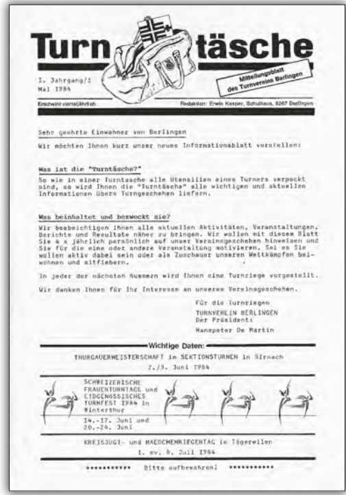
Erstaussgabe der «Turntäsche» Mai 1984.

Ein PC war damals in den Haushaltungen noch nicht anzutreffen und so gab die Gestaltung der «Turntäsche» noch viel Handarbeit. Die Texte wurden erst auf Schreibmaschine, später mit Kugelpf-Schreibmaschine, wo die Möglichkeit bestand, einige verschiedene Schriften zu verwenden, getippt und nachher ausgeschnitten und zu einer Maquette zusammengeklebt, ehe man mit diesen Druckvorlagen zur Druckerei ging. Als gelernter Schriftsetzer waren diese drucktechnischen Herausforderungen für ihn natürlich kein Problem.